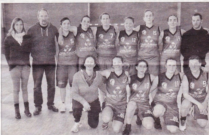
Pour leur deuxième saison en R1, les filles du BCBL veulent assurer leur maintien le plus tôt possible